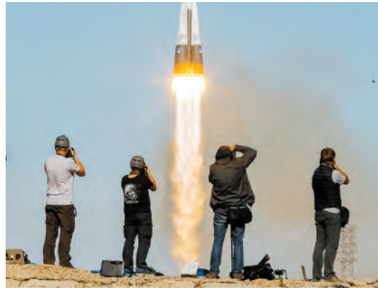
攝影師在哈薩克斯坦拜科努爾發射場拍攝載人飛船的發射。

兩位太空人原計劃在國際太空站駐守約半年。他們準備用一種新型磁性3D打印機以磁懸浮技術製作小鼠的甲狀腺和軟骨組織，並將檢查目前與太空站對接但今年8月出現裂縫的一艘載人飛船。