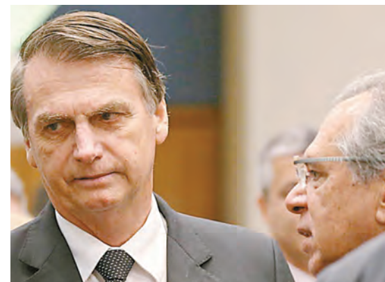
巴西總統熱門候選人博爾索納羅（左）先前說，如果成功當選總統，將任命格德斯（右）出任巴西經濟部長。

支持率為58%。阿達落後，支持率為42%。此次民調由巴西權威民調機構Datafolha於10日完成對巴西全國227個城市的3235人進行抽樣調查，誤差率為正負兩個百分點。