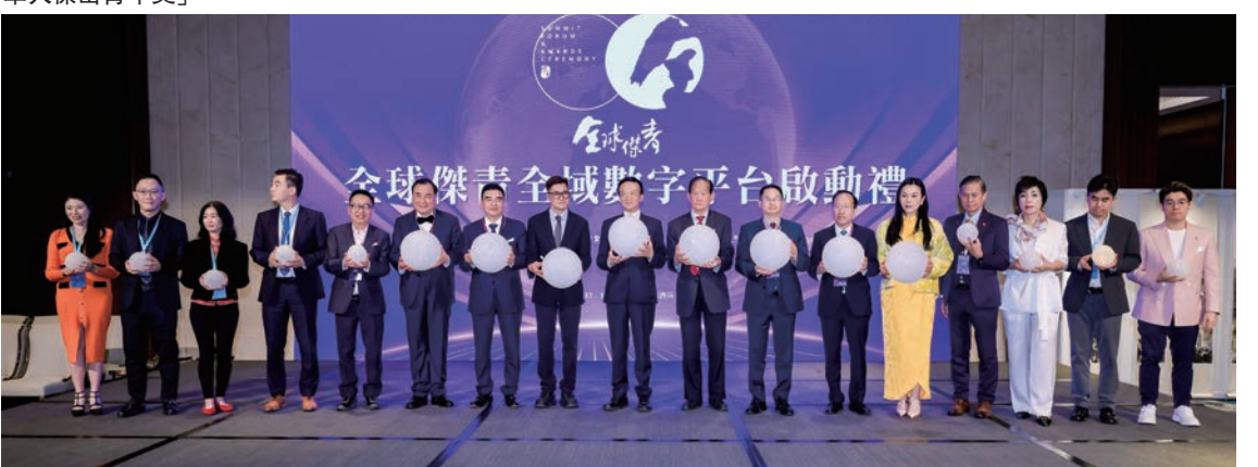
「全球傑青全域數字平台」正式啟動，標誌著華人青年交流和個人IP進入數字新紀元。