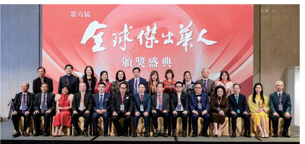
17位傑出人士獲頒「全球傑出華人獎」，與主禮嘉賓在頒獎盛典上合照。