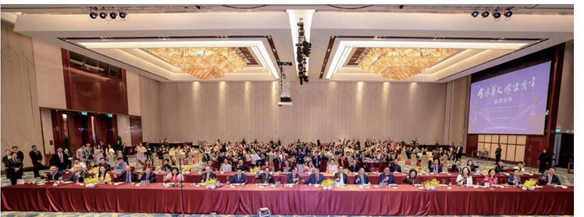
「2025 全球傑出華人高峰論壇暨頒獎盛典」在澳門隆重舉行。圖為高峰論壇全場大合照。