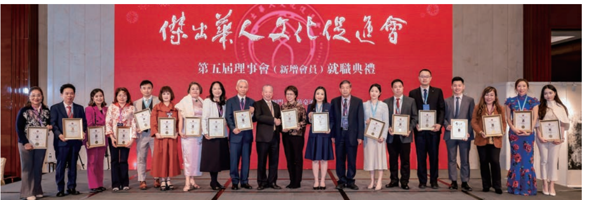
傑出華人文化促進會第五屆理事會新增會員在就職典禮上合照。