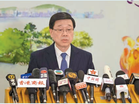
李家超昨晚在京見媒體記者。

律政司副司長張國鈞表示，習主席非常關心香港的情況，認同行政長官認真履行職責，帶領特區政府勇於擔當、積極進取，對此深感鼓舞。他注意到內地各省市正圍繞「十五五」規劃建議提出的主要目標和戰略任務，密鑼緊鼓地制定未來五年地方經濟社會發展藍圖，香港特區亦要充分發揮自身在「一國兩制」之下的獨特優勢，在規劃建議中找準在國家戰略中的定位，以激活區域發展的新動能。香港要深化國際交往合作，發揮「內聯外通」功能，主動協助內地企業利用香港作為「出海」平台，將香港發展推上新台阶。