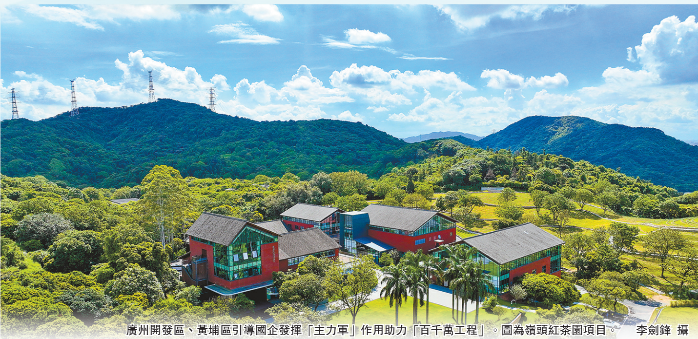
廣州開發區、黃埔區引導國企發揮「主力軍」作用助力「百千萬工程」。圖為嶺頭紅茶園項目。

持。「這種「政府引導+國企實施+金融支持」的架構，有效破解了鄉村重大項目融資難、周期長的瓶頸。」陳燦說。 國企的平台作用不止於單一項目，更在於系統性的片區開發和價值激活。在長洲街道，國企深度參與，將荒廢土地系統整治，打造為集農耕體驗、自然研學、休閒娛樂於一體的現代農業公園；利用舊製衣廠車間創新運營「咖裏烘焙學院」項目，實現工業遺存向文旅地標和教育基地的華麗轉身。2025年1—9月，僅長洲街道限額以上住宿餐飲營業額就近4500萬元，同比增長77.9%，彰顯了國企主導下片區開發的綜合效益。 人才賦能：藝術與創意「下鄉」 激活鄉村內生青年動力 鄉村振興，關鍵在人，尤其在於富有活力和創造力的青年人才。該區通過搭建平台、優化環境，積極引導青年人才、藝術家和創客返鄉入鄉，讓藝術、創意與科技在田野鄉間生根發芽，為「百千萬工程」注入了源源不斷的青年動力。 長嶺街道黃麻社區，這個森林覆蓋率高達97%、擁有國家登山健身步道示範工程的社區，憑借其絕佳的生態稟賦，吸引了大量青年創客。 當地採用「街道主導+社會運營」模式，系統規劃了長嶺·天鵝谷項目。其中，「鵝山新所」藝術中心將藝術與社區、藝術與產業深度融合，設有藝術市集、茶室、輕餐飲區，手作陶器等文創產品琳琅滿目；二層布局研習室與展覽空間，可滿足展覽、