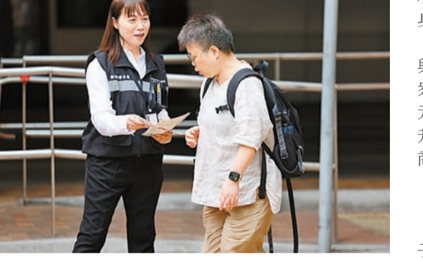
衛生署控煙酒辦人員昨日上午在金鐘一帶巡查和執法，並向途人派發傳單。

【香港商報訊】記者萬家成報道：香港控煙新規昨日正式實施，禁止在公眾地方管有電子煙煙彈、加熱煙煙支等指明另類吸煙產品，隨身攜帶亦屬違法。新規實施恰逢「五一黃金週」假期前夕，有在港旅行的遊客認爲措施值得稱讚。