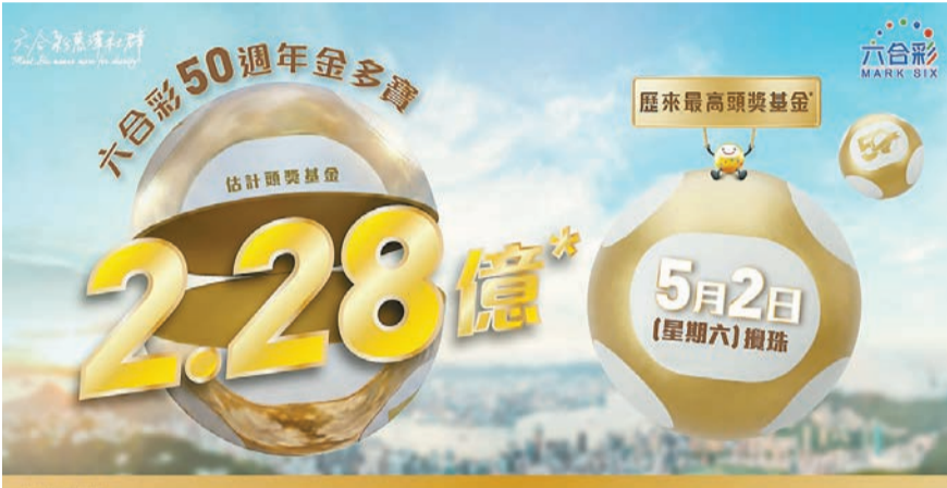
馬會星期六推出的金多寶估計頭獎基金為2.28億元，是歷來最高的頭獎彩金。

他續稱，回望過去50年，數以億計的六合彩彩票產生逾300億福利的額外資源，成就25000個項目，惠及超過300家非政府機構，作用非常大。展望未來相信通過政府、社福界和香港賽馬會的三方聯動合作，一定可以再用好香港這個獨有的六合彩項目，既為大家繼續帶來歡樂和希望，也為社福界帶來額外資源，幫助有需要的人。