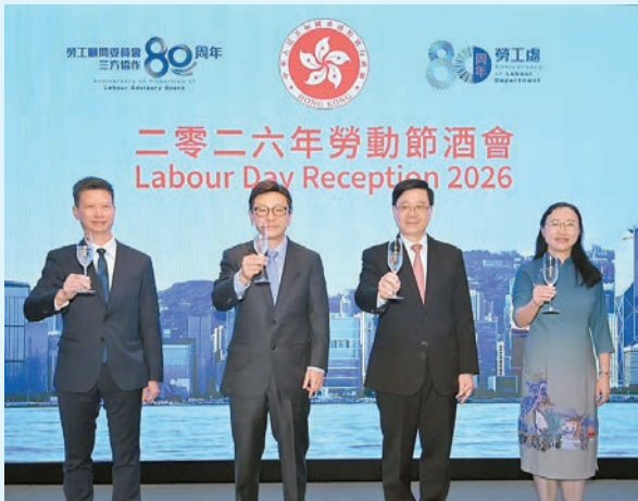
行政長官李家超(右二)昨日出席勞工處舉辦的勞動節酒會，並與勞福局局長孫玉菡(左二)等祝酒。