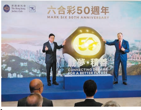
勞福局局長孫玉菡(左)與馬會行政總裁應家柏(右)為「六合彩50周年展覽」舉行亮燈儀式。

【香港商報訊】記者李銘欣報道：馬會為慶祝六合彩推出50周年，將推出兩期金多寶。首期將於星期六舉行，估計頭獎基金為2.28億元，是歷來最高的頭獎彩金。同時，馬會由今日至10日在中環大館舉辦六合彩50周年展覽。勞福局局長孫玉菡昨日在展覽開幕禮上致辭時稱，過去50年，六合彩彩票產生逾300億福利的額外資源，未來通過政府、社福界和香港賽馬會的三方聯動合作，一定可以再用好香港這個獨有的六合彩項目，幫助有需要的人。