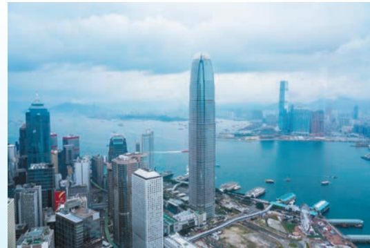
本港5月PMI回升至50.4，為3個月以來首次重返50以上擴張區間，反映營商環境重拾景氣。資料圖片

標普全球經濟學家Usamah Bhatti指，香港特區採購價格升幅創4年半新高，尤其燃油相關產品價格飆升，整體投入成本持續攀升。為刺激銷量，部分企業推出減價優惠，產出售價整體升幅較上月收窄，反映企業自行消化部分成本增幅。 展望未來，業者雖對經營前景持續看淡，但悲觀情緒已淡化至3個月來最低。受訪企業表示，價格高企、關稅政策及地緣政治風險等因素，仍是影響業務前景的主要憂慮。