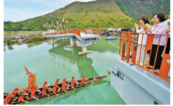
發展局局長甯漢豪（左）和民青局局長麥美娟（右）在鹽田橋上觀賞表演。

關設施可配合龍舟遊涌傳統節慶活動，提供更完善的觀賞空間，有助營造更熱鬧的節日氣氛，並帶動大澳經濟及旅遊發展。