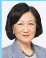
葉劉淑儀 GBM GBS JP