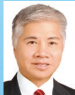
楊釗 博士 院士 GBS SBS JP