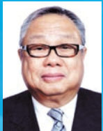
陳永棋 GBM GBS OBE JP