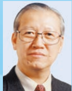
袁武 GBS JP