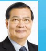
譚耀宗 GBM GBS JP