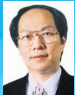
戴德豐 博士 GBM GBS JP