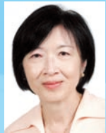
羅范椒芬 GBM GBS JP