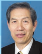
盧文端 博士 GBM GBS JP