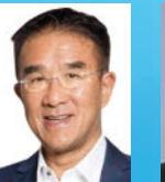
田北辰 BBS JP