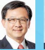
何君堯 BBS JP