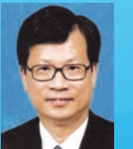
鄭耀棠 GBM GBS JP