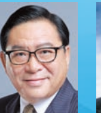
林健鋒 GBM GBS MBE JP