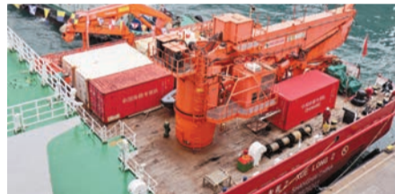
船艙甲板設置有重型吊機。

【香港商報訊】記者戴合聲報導：在歷經5個多月南極科學考察後，中國第一艘自主建造的極地科學考察破冰船「雪龍2」號昨日首次到訪香港，展開為期5天的活動，這是繼「雪龍」號2004年停靠香港後，中國極地科考破冰船時隔近20年再度訪港。香港「雪龍2」號訪港籌備委員會在尖沙咀海運碼頭舉行歡迎儀式。香港特區行政長官李家超、中央政府駐港聯絡辦主任鄭雁雄、國家自然資源部副部長孫書賢等出席活動並主禮。香港各界逾300位嘉賓參加。