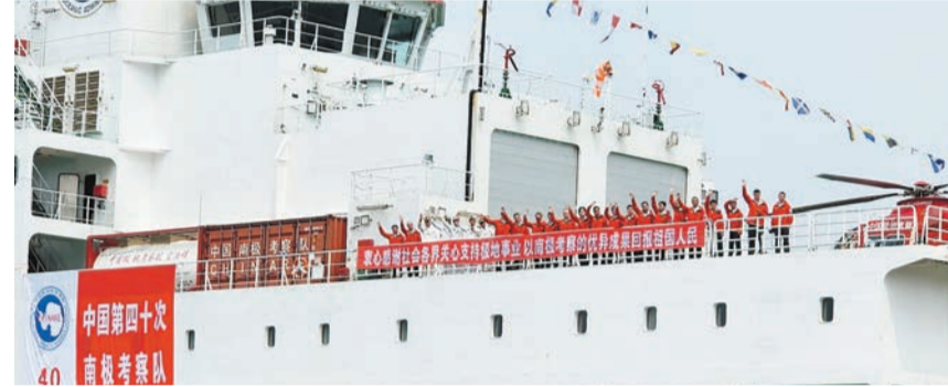
船員在甲板上向岸上等候的市民揮手。記者 木子攝