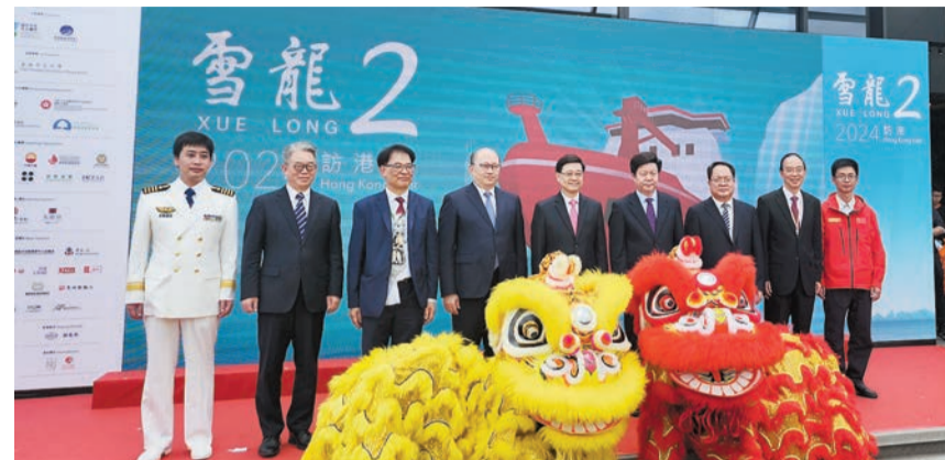
李家超（左五）、鄭雁雄（左四）、孫書賢（左六）等出席雪龍2號歡迎儀式。