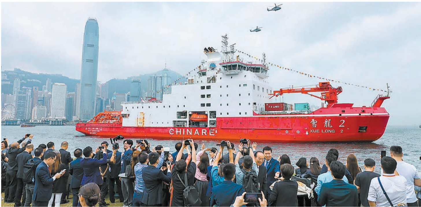
雪龍2號破冰船訪港，市民在岸上歡迎。