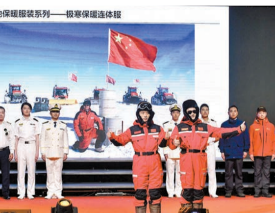
雪龍2號科考隊員在文藝晚會亦上演服裝秀，表現親民。

中國第28次南極考察隊副隊長李院生則主講《冰穹A故事》，稱崑崙站建於海拔4000米的南極最高點冰穹A，極度